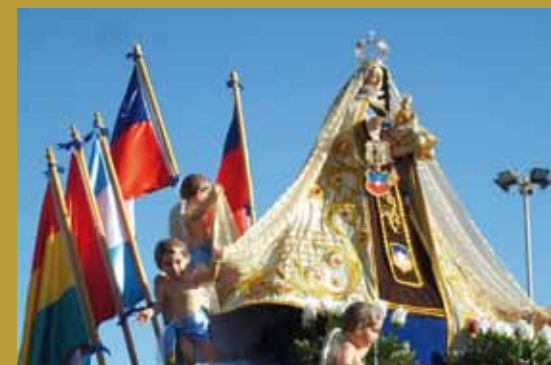
“La Chinita” - Virgen del Carmen de La Tirana.

Después de la Guerra del Pacífico, la Virgen del Carmen, tanto en los estandartes como sus figuras, pasó a estar acompañada de dos banderas chilenas.