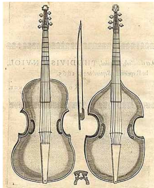
Viola da Gamba. Gravura do livro "The Division Violist", de Christopher Simpson, Inglaterra, edição 1659-1667.