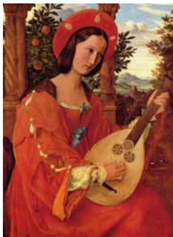
Laud. Julius Schnorr von Carolsfeld. 1794-1872.