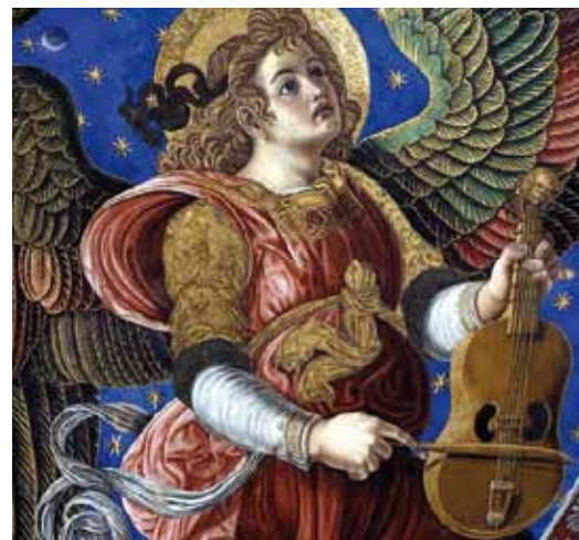
Ángel músico con vihuela de arco. Detalle de la bóveda del altar mayor de la Catedral de Valencia. Fresco de Paolo de San Leocadio y Francesco Pagano, 1474.