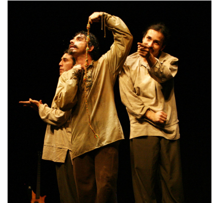
Cautiverio felis (sic)

De acuerdo a lo que conoces de la sociedad chilena, dialoga con tus compañeros respecto a cuáles son las características propias de los habitantes de distintas zonas de nuestro país (por ejemplo: urbana, rural, costera, de montaña, norte, centro, sur) y aquellas que identifican a los chilenos como nación. Defiende tus puntos de vista con argumentos y ejemplos bien desarrollados.