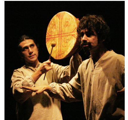
Kay Kay y Xeng Xeng Vilu

Analiza los temas centrales de este mito y compáralos con los de otros mitos de creación de diferentes culturas a través de la historia, luego coméntalos con tu grupo. Considera aspectos como: ¿por qué se repiten los temas en diferentes culturas?, ¿de qué manera han evolucionado estos temas a través de la historia de la humanidad?, ¿qué temas preocupan al hombre contemporáneo?, ¿tiene sentido la temática de esta obra en el mundo de hoy?