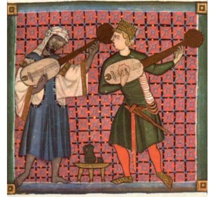
Miniatura de unos juglares en las Cantigas de Alfonso X de Castilla . Siglo XIII. Autor desconocido.

El juglar actuaba en los espacios públicos, contaba con plena aceptación en la sociedad de su época y en la corte cumplía el rol de entretener al rey. Las ocasiones festivas en que el juglar participaba eran, por ejemplo, el regreso de la guerra, la recepción de un extranjero, el nombramiento de un caballero o una boda.