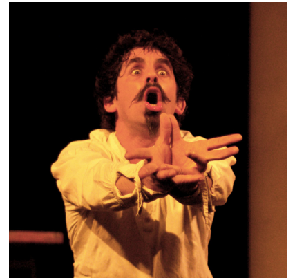
Pedro de Valdivia: la gesta inconclusa

Desde sus respectivas situaciones, tanto los conquistadores españoles como los indígenas que poblaban el territorio nacional tenían características personales y sociales que los impulsaban en su lucha y legitimaban sus acciones. Recuerda lo observado en la obra teatral, escoge aquellas que te parezcan más interesantes o discutibles, analízalas de acuerdo a tu punto de vista personal y al contexto histórico, y luego coméntalas con tu grupo.