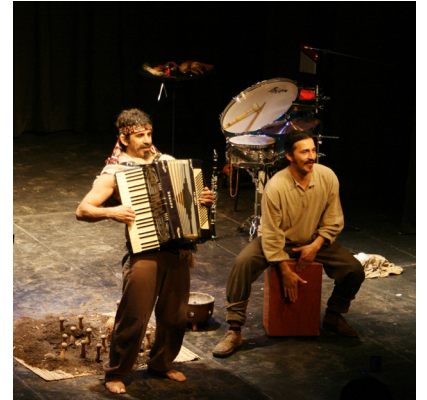
Cautiverio felis (sic)