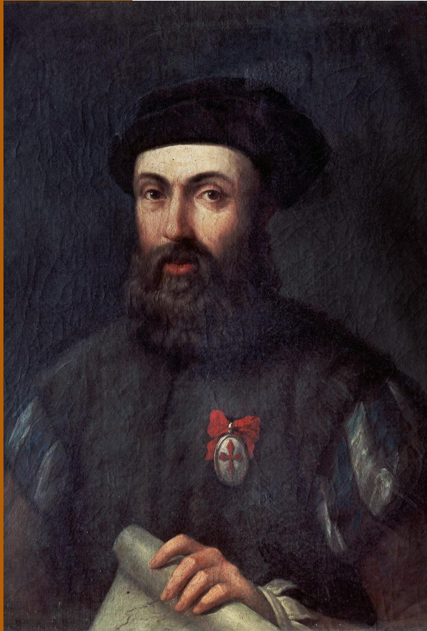
Retrato en óleo, anónimo.

Fernão Magalhães o Hernando de Magallanes fue un portugués nacido el 2 de Enero de 1489, cuyo interés por encontrar una nueva ruta económica, lo llevó a demostrar que la tierra era redonda y descubrir un paso entre el océano Atlántico y Pacífico, que eventualmente recibiría el nombre de “Estrecho de Magallanes” en su honor.