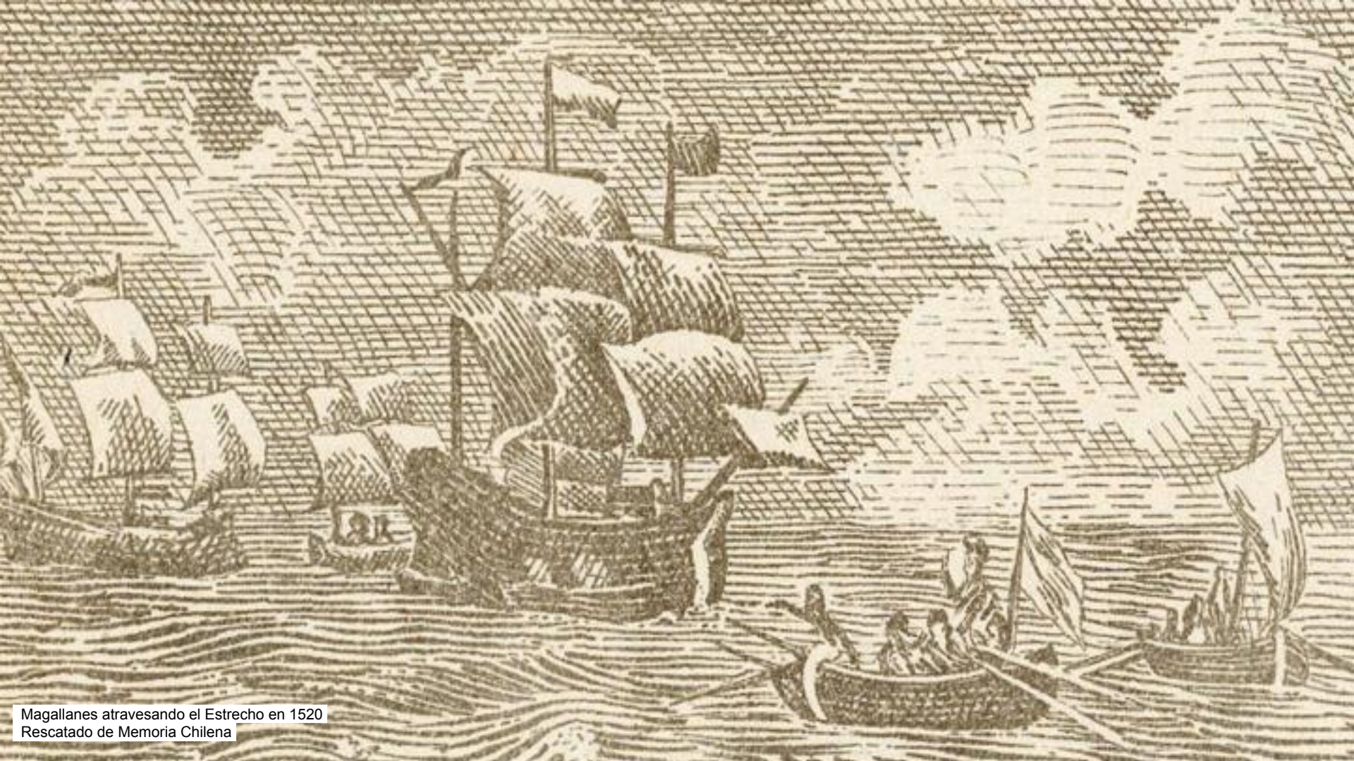
Magallanes atravesando el Estrecho en 1520