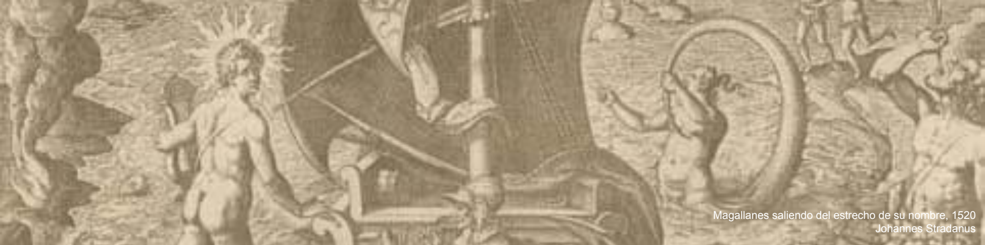
Magallanes saliendo del estrecho de su nombre, 1520 Johannes Stradanus

A pesar de que el viaje resulta un éxito, ya que cumplió con su propósito, hubieron diferentes dificultades. Entre ellas, se destaca el hambre, los abusos, una nave que naufraga, otra que deserta, entre otras. La pérdida de víveres, de la mayoría de la tripulación y la incertidumbre de los días de retorno a España producto de ser un terreno desconocido, provocaron conflictos entre los diferentes encargados de las naves