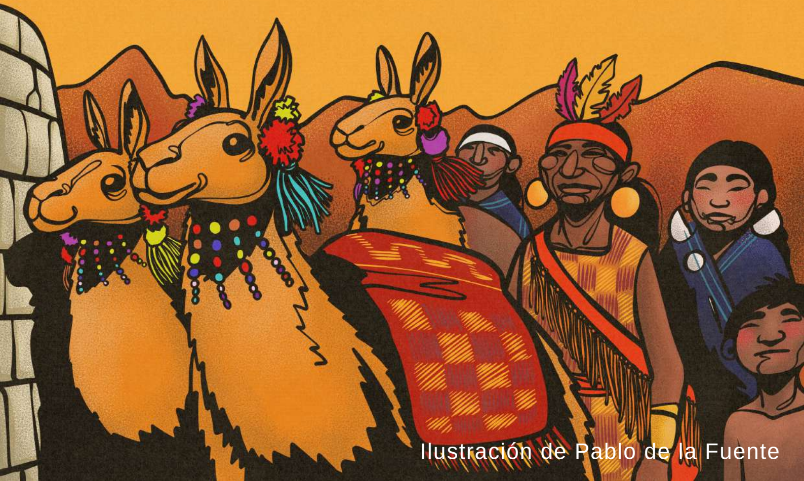
Ilustración de Pablo de la Fuente